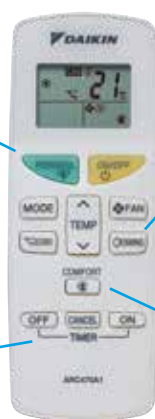
Telecomandă pentru FTXF-A

*La 1 h după activarea modului de noapte, valoarea setată crește în răcire sau scade în încălzire pentru a asigura condiții confortabile de somn